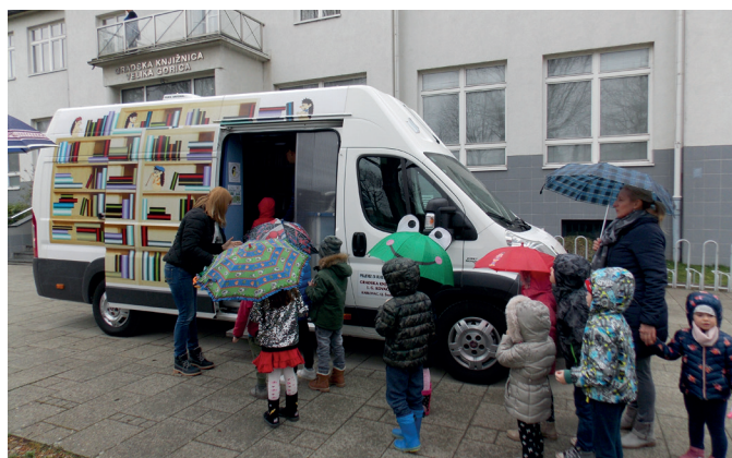
Slika 4. Bibliokombi Gradske knjižnice „Ivan Goran Kovačić“ iz Karlovca ispred Gradske knjižnice Velika Gorica