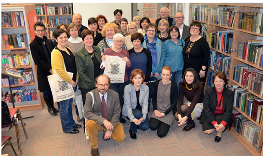
Slika 1. Posjet IFLA-ine Sekcije za narodne knjižnice Gradske knjižnici Velika Gorica

U 2016. godini obilježena je 130. obljetnica Gradske knjižnice Velika Gorica te je u sklopu međunarodnog stručnog okupljanja organizirano predavanje o aktivnostima Knjižnice za kolege iz IFLA-ine sekcije za narodne knjižnice.